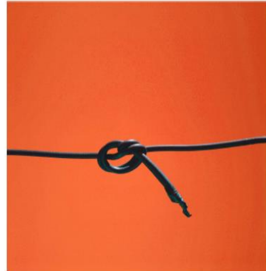
Del 1 Översikt